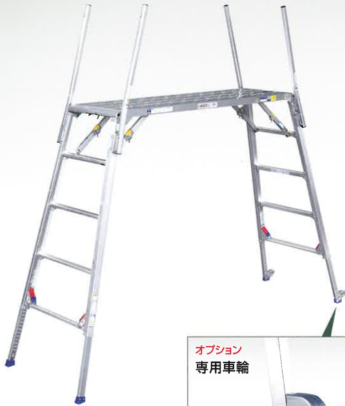
オプション 専用車輪